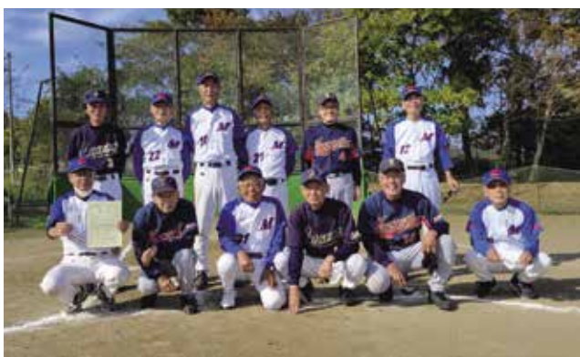
2021年シニア大会 (馬込・ゆずり葉・ライガース)