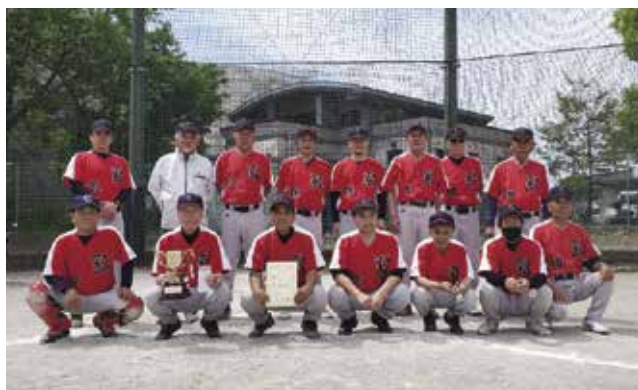
2021年春季Ⅲ部優勝（椿山レッド）