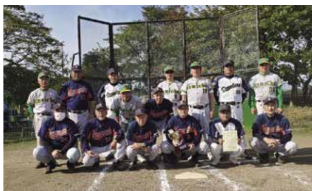
2020年実年大会優勝（オール中央実年）