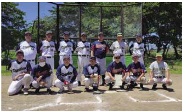
2021年実年大会優勝（オール中央）