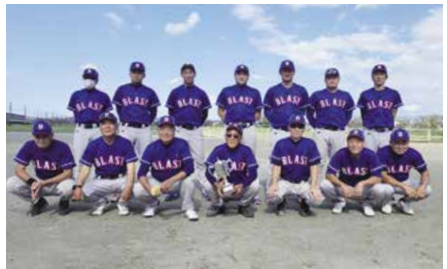
2021年秋季大会 II 部優勝 (プラストセンターズ)