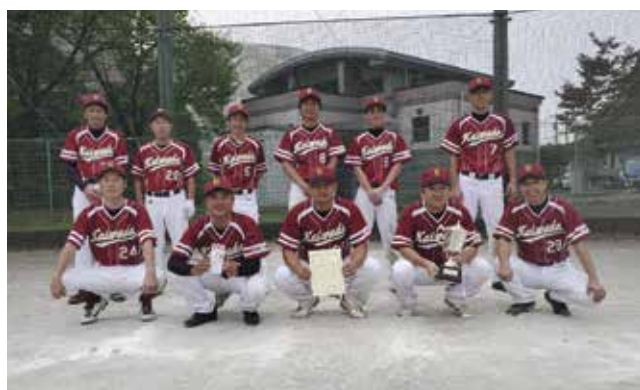
2020年秋季Ⅱ部優勝（貝和田ソフト）