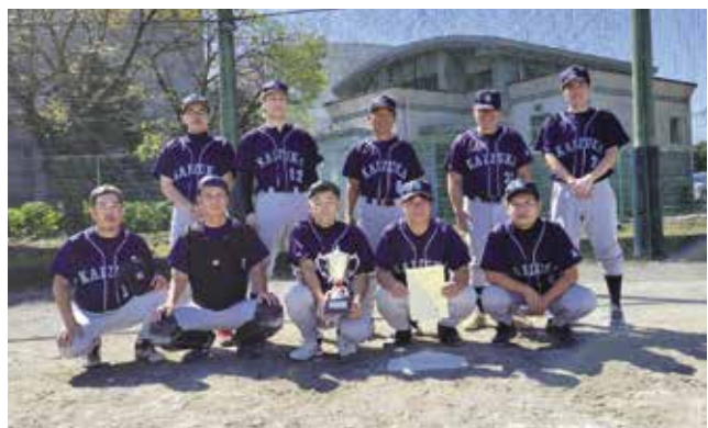
2021年秋季大会Ⅲ部優勝（貝塚ソフト）