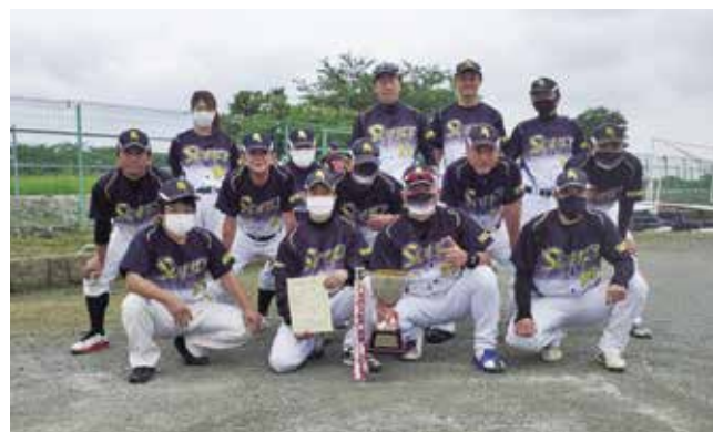
2021年壮年優勝（ソールズ壮年）